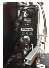
zentrale Betätigung von Startschloss, Choker, Gas und Drehzahl