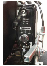
zentrale Betätigung von Startschloss, Choker, Gas und Drehzahl