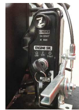
entrale Betätigung von artschluss, Choker, Gas und Drehzahl